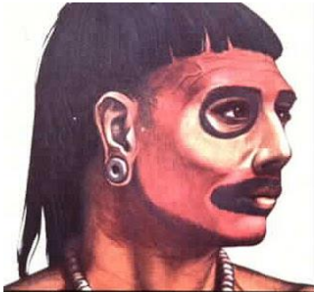
Aborigen de la Isla de Santo Domingo. Español del siglo XV.