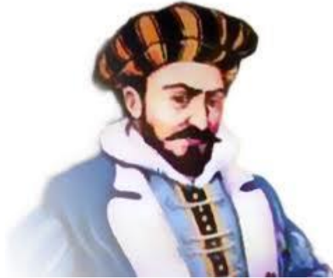
Español del siglo XV.